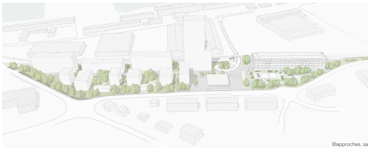
PAD Les Taconnets - Croquis représentant le projet de cycle d'orientation (à droite) et illustrant une organisation possible du quartier (à gauche) — Mai 2024

Les Transports publics fribourgeois Immobilier (TPF IMMO) SA développent un projet de nouveau quartier sur le site « Les Taconnets ». Celui-ci prévoit le renouvellement total de la friche industrielle pour la transformer en un quartier orienté vers et pour l'avenir, qui dynamisera le nord de la commune et profitera au plus grand nombre. Sur une surface totale d'un peu moins de 3.3 hectares, l'ancienne friche industrielle laissera place à de nouveaux bâtiments pour le cycle d'orientation (CO) et une gare routière à l'est. À l'ouest, le projet prévoit la réalisation d'un quartier d'habitation mixte incluant des commerces et des bureaux.