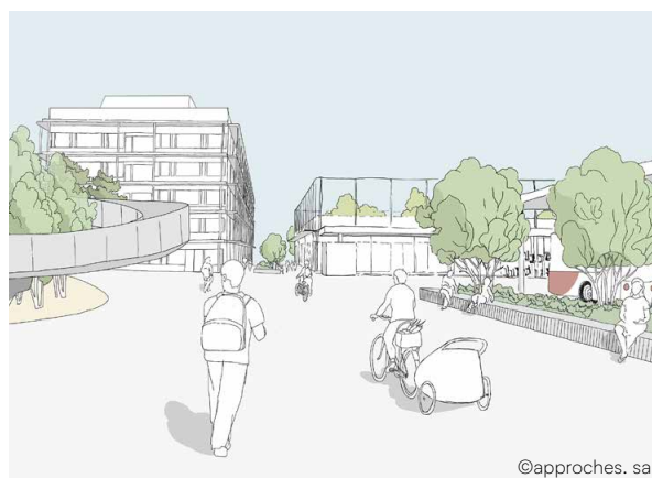
PAD Les Taconnets - Croquis représentant le projet de cycle d'orientation (en arrière-plan) et illustrant une organisation possible du quartier (sur la droite) — Mai 2024

Des places de stationnement en ouvrage souterrain seront à disposition de la population résidente de ce nouveau quartier tout comme de leurs visiteur·euses. Les exploitant·es des commerces et bureaux, leur personnel, leur clientèle et les employé·e-s du CO pourront également en bénéficier.